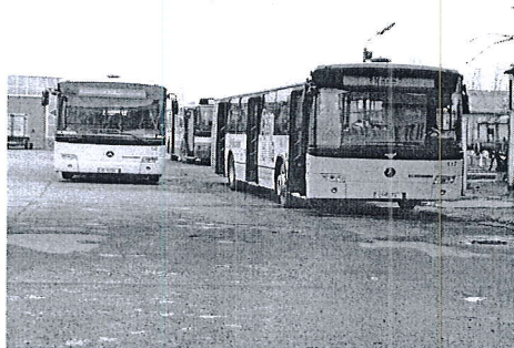
Autobuz Mercedes Connecto

În anul 2015 autobuzele au executat un parcurs de 4.065,2 mii km din care 3.071 mii km pe traseele urbane curse regulate și pe traseele care au înlocuit tramvaiele, 732,9 mii km pe trasee metropolitane + RO-HU și 197,2 mii km pe trasee curse regulate speciale.