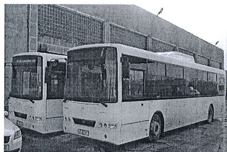
Autobuz Volvo Alfa Localo